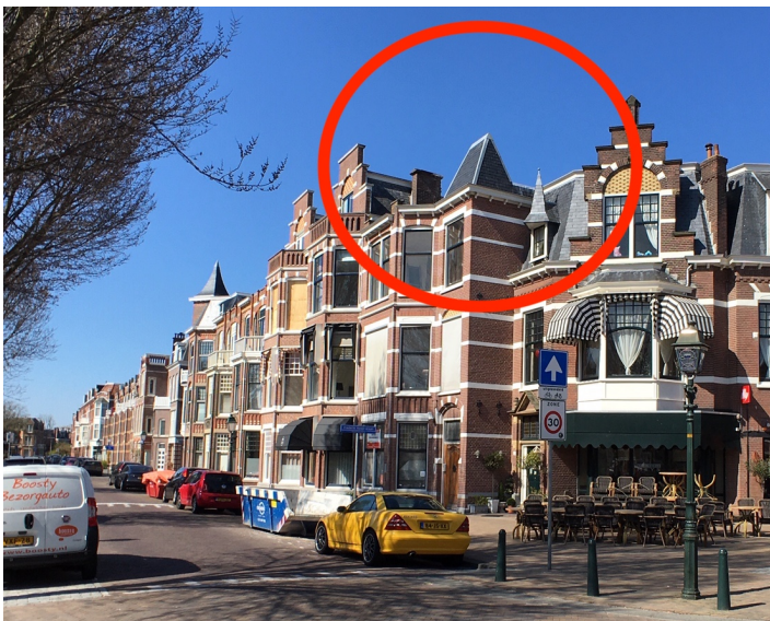
Frederik Hendrikplein 34 met omcirkeld torentje

Onlangs is een omgevingsvergunning verleend voor Frederik Hendrikplein 34. Dit houdt in dat het torentje wordt gesloopt en plaats maakt voor een dakopbouw, zie onderstaande afbeeldingen.